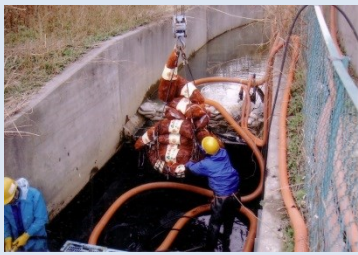
美浜町は竹炭とEMによる町づくりをしています。