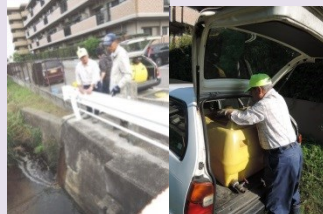
刈谷市は81歳の方が毎月4t