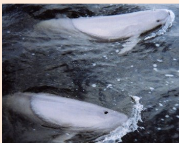
絶滅近いスナメリ復活