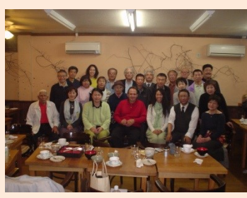
ハワイからの参加者あり