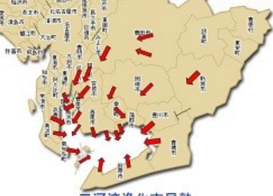
三河湾浄化市民塾

みんなでやれば大きな力になり、希望と勇気を分かち合えます。EMのおかげで初めて会ってもすぐ意気投合して協力し合っています。