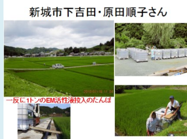
新城市は田んぼに50t投入