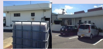
浄化槽にも活用して成果大です。