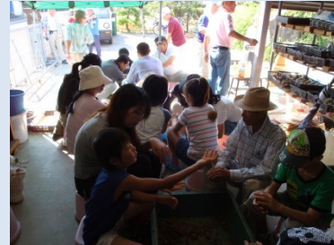
武豊町は毎月第三火曜日活動