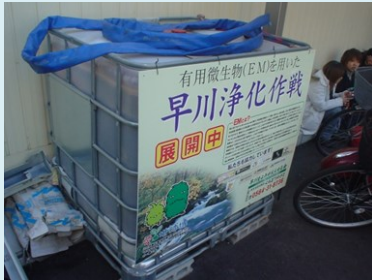
岡崎市はラーメン屋Pから