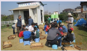
半田市は毎月第二火曜日活動