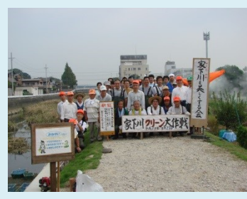
豊田市はクリーニング屋さん他